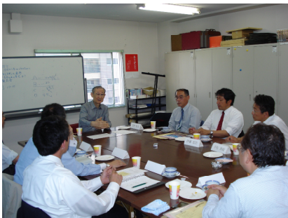
茶話会の一部はホームページにて http://www.i-mentor.jp