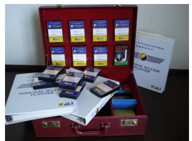
たったこれだけで55万円？

それには、私はこのテープ学習というのは、本当によい仕掛けだと思います。繰り返す、繰り返す聞くとはなして聞く。「問を置いた反復」これがよい習慣を身につける方法だと思います。