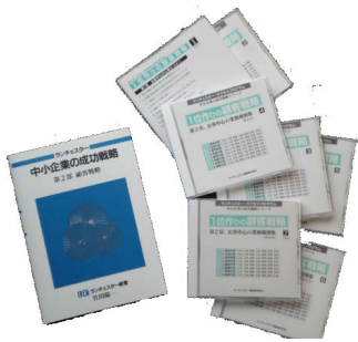
戦略教材です。パンフレットあります